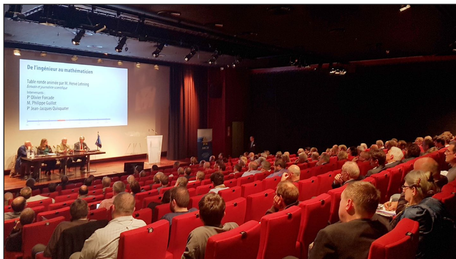
Le magnifique amphithéâtre de la Bibliothèque nationale de France

La meilleure façon de lui rendre hommage est de réussir ce colloque.