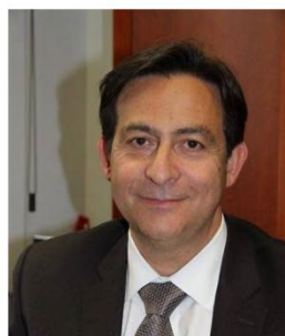
Intervenant Jean-Marc Souvira Commissaire général de police