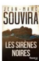
Les sirènes noires