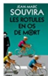
Les rotules en os de mort