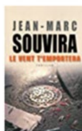
Le vent t'emportera