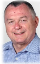
Bernard Besson ex DGS Les aspects philosophiques