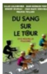
Du sang sur le Tour